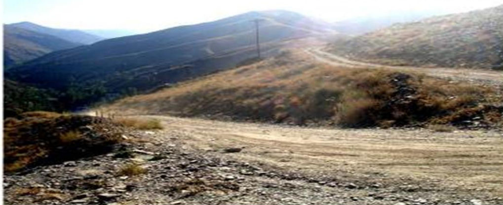
جاده ورودی فعلی به سایت پایین